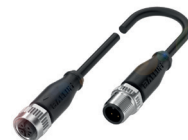
Câble de capteur trifilaire pour le raccordement de capteurs IO-Link

Le module IO-Link Master est disponible pour tous les bus de terrain courants. Il dispose d'une entrée et d'une sortie courant, ainsi que d'une entrée et d'une sortie bus de terrain. De plus, en fonction du domaine d'application, différents nombres de ports sont à votre disposition.