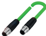
Câble de bus de terrain pour l'interconnexion du module IO-Link Master avec l'API ou d'autres utilisateurs du bus de terrain