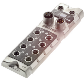
Module IO-Link Master en métal pour une utilisation décentralisée

Au fil du temps, un grand nombre de bus de terrain différents se sont établis dans l'industrie. Étant donné que l'IO-Link est indépendante du bus de terrain, le niveau des appareils reste inchangé avec l'IO-Link – quel que soit le bus de terrain que vous utilisez.