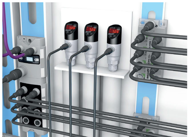
Connexion d'un module IO-Link Master avec des répartiteurs de capteurs / actionneurs IO-Link et des capteurs de pression IO-Link

Le transport des signaux à l'intérieur d'une machine (entre les capteurs / actionneurs et l'API) ou également à l'échelle de l'installation (entre les API) s'effectue via des bus de terrain. Cela permet entre autres une communication sur de grandes distances.