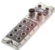
Module de bus de terrain Ethercat en métal pour les applications décentralisées (8 emplacements)

L'avantage de ces bus de terrain ne réside pas seulement dans la communication sur de grandes distances, mais également dans la fonction de diagnostic. De plus, la transmission des signaux sur le bus de terrain a besoin d'un nombre réduit de conducteurs par rapport à la transmission des signaux à l'aide d'un répartiteur passif.