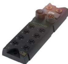
Module de bus de terrain Ethernet/IP renforcé à la fibre de verre pour les environnements particulièrement difficiles (8 emplacements)