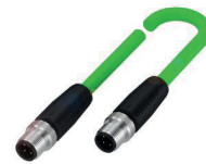
Câble de bus de terrain pour le raccordement du module de bus de terrain à la commande

Il existe un grand nombre de modules de bus de terrain différents :