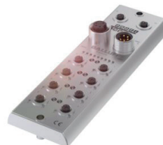
Module de bus de terrain Profinet en acier inoxydable pour les domaines hygiéniques (8 emplacements)