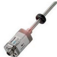
Système de mesure de position magnétostrictif pour une précision élevée et, de ce fait, solution intégrable de façon optimale dans des vérins hydrauliques

Les technologies de capteur suivantes sont par exemple appropriées pour la mesure de position linéaire :