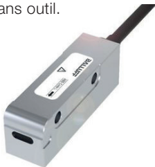
Grâce à sa précision exceptionnelle, le système de mesure de déplacement à codage magnétique est parfaitement approprié pour des entraînements linéaires.

Sur une machine-outil, l'état de serrage d'une broche doit être surveillé en continu pendant l'usinage. Ceci permet d'améliorer les résultats sur la pièce et augmente simultanément la fiabilité du système complet. Des systèmes de mesure de position inductifs envoient un retour d'information continu à l'automate, afin de savoir si la broche est desserrée, serrée avec un outil ou serrée sans outil.