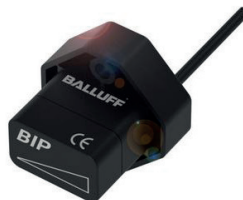
Le système de mesure de position inductif, sa fiabilité de répétition et sa linéarité, constitue la solution idéale pour des applications telles que la surveillance de l'état de serrage.