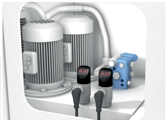
Mesure des pressions dans un groupe hydraulique – p. ex. d'une machine-outil – à l'aide de deux capteurs de pression IO-Link

Dans une station d'enroulement, il faut surveiller continuellement le diamètre de rouleau et la flèche. Les capteurs de distance optoélectroniques fonctionnant sans contact constituent une solution sûre. Avantage supplémentaire : l'interface IO-Link améliore nettement la qualité des signaux, comparée aux produits précédents.