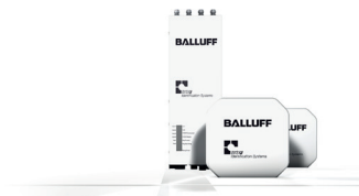
Antenne et unité d'exploitation d'un système RFID UHF destiné à la lecture et à l'écriture sur de grandes portées

Lorsque vous souhaitez identifier de façon fiable un objet dans la production afin de contrôler le flux de matières, il requiert un support de données. Il peut par exemple s'agir d'une étiquette RFID ou d'un code à barres. Lorsque l'objet se déplace avec le support de données à travers la fabrication, un appareil approprié est capable de lire (p. ex. un numéro de série) à partir du support de données dans tous les endroits où l'objet doit être identifié. Ces données sont transmises à une unité d'exploitation, qui les transmet à son tour à un automate, à un PC ou à un niveau informatique supérieur, afin de prendre des décisions concernant la production ou la qualité. Il existe fondamentalement deux technologies d'identification : la RFID, l'identification par radiofréquence (ondes radioélectriques) et le lecteur de codes à barres (enregistrement et évaluation d'images).