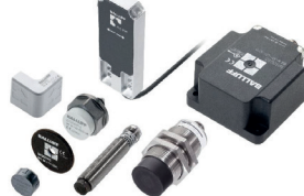
Têtes de lecture/écriture et supports de données de différentes formes, adaptés aux besoins de l'utilisateur