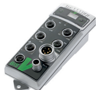
Unité d'exploitation indépendante de la fréquence d'un système RFID destiné à l'exploitation de plusieurs têtes de lecture/écriture ou antennes