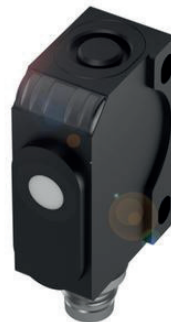
Sensor ultrasónico para la detección de niveles de llenado – sin contacto con el medio – incluso a grandes distancias.

Dependiendo del ámbito de aplicación, puede utilizar diferentes tecnologías para la detección del nivel de llenado: