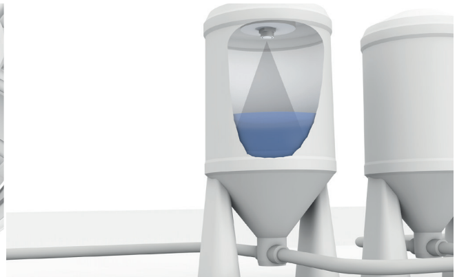
Los sensores ultrasónicos comprueban el nivel de llenado de los depósitos.

Los sensores capacitivos detectan el nivel de llenado de material granulado en un contenedor con total precisión. Para ello se colocan dos sensores en diferentes puntos del contenedor. Cuando se supera o no se alcanza el nivel, se emite una señal. De esta forma se impide el llenado excesivo, se evita que el nivel de llenado se sitúe por debajo del nivel mínimo y se reduce el tiempo de paro de la máquina. Los sensores capacitivos están diseñados para ser flexibles y fáciles de instalar.