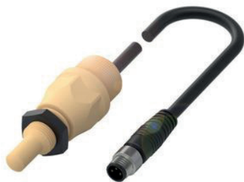
Sensor capacitivo para la detección de niveles de llenado – con o sin contacto con el medio – a corta distancia

Los sensores ultrasónicos detectan sin contacto el nivel de llenado exacto de un depósito. De esta forma se garantiza la continuidad del proceso de llenado. Los sensores ultrasónicos son fiables incluso a grandes distancias y no requieren de elementos adicionales como, por ejemplo, reflectores.