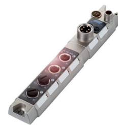
4-Port-IO-Link-Master mit Profibus-Schnittstelle

Beim IO-Link-basierten automatisierten Identifizieren benötigen Sie lediglich drei Komponenten: