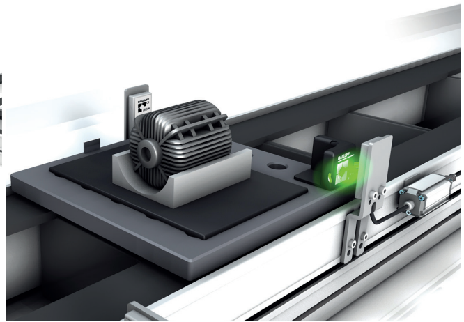
Auslesen des Datenträgers mittels RFID Schreib-/Lesekopf mit separater Controllereinheit bei beengten Platzverhältnissen

Ein RFID-Schreib-/Lesekopf liest den von zwei Seiten lesbaren Eckdatenträger aus. Beide Produkte sind speziell für die Montage an standardisierten Werkstückträgersystemen und genormten Profilsystemen konzipiert. Dazu schließen Sie den RFID-Schreib-/Lesekopf an die IO-Link-Mastereinheit an, an die sich wiederum bis zu vier IO-Link-Geräte anschließen lassen. Über Profibus werden die Daten der übergeordneten Steuerung zur Verfügung gestellt.