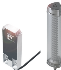
Schreib-/Lesekopf und Signalleuchte mit IO-Link-Schnittstelle