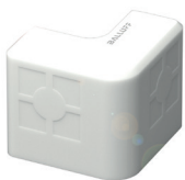
Eckdatenträger für Werkstückträger für Anlagen im Bereich Montage und Handling, mit bis zu 2KB Datenspeicher

Steht Ihnen wenig Platz zur Verfügung, ist ein kleiner Schreib-/Lesekopf mit separater Controllereinheit ideal.