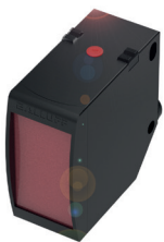
IO-Link-fähiger optoelektronischer Distanzsensoren zum Messen von Abständen

In einem Hydraulikaggregat – z.B. in einer Werkzeugmaschine – ist der Druck zuverlässig zu kontrollieren. Mit IO-Link-Drucksensoren erhalten Sie deutlich genauere Messwerte und profitieren von einer einfachen Installation durch Plug-and-Play mit ungeschirmtem Standardkabel.