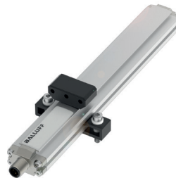
IO-Link-fähiges magnetostruktives Positionsmesssystem zum Messen linearer Positionen