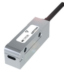
IO-Link-fähiges magnetkodierte Positionsmesssystem zum Messen linearer und rotativer Positionen

Je nach Anwendungsschwerpunkt Ihnen stehen unterschiedliche IO-Link-fähige messende Sensoren zur Auswahl: