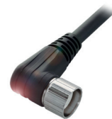
Steckverbinder in M23 zwischen passivem Verteiler und SPS

Es gibt eine Vielzahl passiver Verteiler. Diese unterscheiden sich z. B. in der Version (M8 oder M12), im Anschluss zur SPS (Kabel, Haube oder Stecker) und in der Anzahl der Steckplätze (4 bis 10). Sie bestehen meist aus Kunststoff. Eine LED informiert Sie über den Zustand der angeschlossenen Geräte.