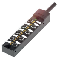
Passiver Verteiler in M8 mit Kabelanschluss (8 Steckplätze)

Passive Verteiler werden oft mit Status-LEDs ausgestattet, die den Gerätezustand anzeigen. Dies ist sehr hilfreich, um Störungen in einer Anlage zu lokalisieren.