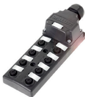
Passiver Verteiler in M12 mit Hausanschluss (8 Steckplätze)