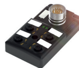
Passiver Verteiler in M12 mit Steckeranschluss (4 Steckplätze)