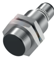
Schreib-/Lesekopf in kompakter Bauform, mit einfacher Handhabung und Montierbarkeit