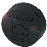
Datenträger, speziell für die Werkzeugidentifikation, direkt in Metall einbaubar

Auch auf Spritzgießformen und Stanzwerkzeugen werden RFID-Tags angebracht. Diese Datenträger liefern Informationen zu Einstellparametern sowie Daten zur Verwendung, Wartung und Zuordnung zur Maschine, in der diese eingesetzt sind. Ein RFID-Schreib-/Lesegerät kann die Daten auslesen und an die Maschinensteuerung weiterleiten. So werden Condition Monitoring und Predictive Maintenance möglich.