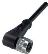
Steckverbinder für den Anschluss von Geräten