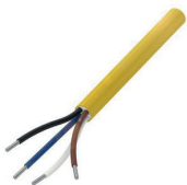
Kabel zwischen Klemmleiste und SPS

Normalerweise besteht eine Produktionsmaschine aus diversen Ein-/Ausgabegeräten, wie z. B. Antrieben, Sensoren, Aktoren oder Signalleuchten. Alle diese Geräte erzeugen oder benötigen Signale im Austausch mit dem zentralen Steuerschrank. Im Steuerschrank befinden sich die SPS, die zentrale Stromversorgung und gegebenenfalls eine Bedienoberfläche (HMI) für die Anlage. Die Übertragung der analogen und digitalen Signale der Ein-/Ausgabegeräte im Feld erfolgt über Leitungen, die direkt mit den Ein-/Ausgangskarten der zentralen Steuerung oder auch über Klemmleisten verdrahtet werden.