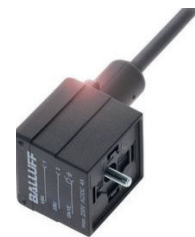
Ventilstecker für den Anschluss von Ventilen

Bei einer Direktverbindung vom Gerät zur SPS ist der Verdrahtungsaufwand am höchsten. Denn jede Ader im Kabelmantel muss mit der richtigen Karte der Steuerung verdrahtet werden. Mithilfe von Klemmleisten, die zwischen Gerät und SPS angebracht werden, können die Adern gebündelt werden. Steckverbinder helfen beim Anschluss eines entsprechenden Sensors an die SPS oder Klemmleiste. Möchten Sie ein Ventil mit der SPS verbinden, so ist ein Ventilsteckverbinder der richtige.