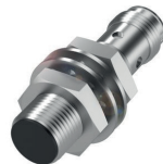
Sensor mit Steckverbinderanschluss zur Signalausgabe für die SPS