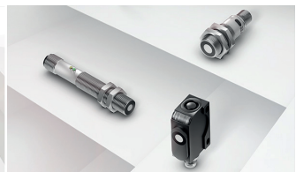
Mithilfe von Schall erfassen Ultraschall-Sensoren nahezu alle Objekte unabhängig von Farbe und Beschaffenheit.

Je nach Anwendungsgebiet können Sie unterschiedliche Technologien einsetzen: