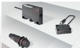
Kapazitive Sensoren erfassen die Anwesenheit oder den Füllstand nahezu aller Materialien und Flüssigkeiten.