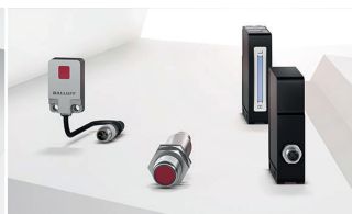
Mithilfe von Licht erfassen optoelektronische Sensoren fast alle Objekte.