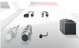
Induktive Sensoren erfassen alle metallischen Objekte.

Optoelektronische und Ultraschall-Sensoren werden üblicherweise eingesetzt, um Objekte zu erkennen, die weit entfernt sind ( > 50 mm). Induktive oder kapazitive Sensoren eignen sich besser bei Objekten, die einen geringeren Abstand zum Sensor haben ( < 50 mm).