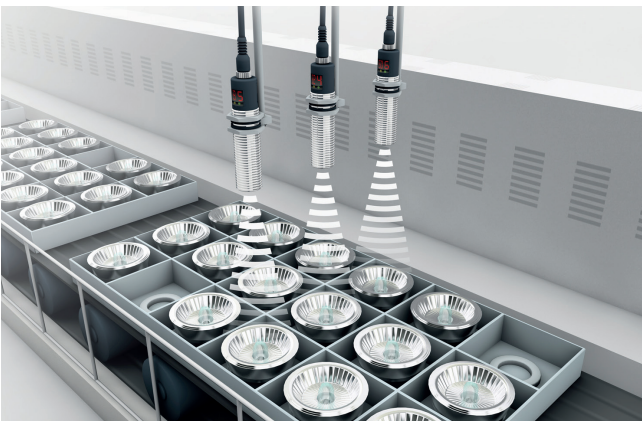
Bauteile werden während des Transports auf Anwesenheit, Lage und Vollständigkeit geprüft.

In der Automatisierung haben Sie viele Möglichkeiten, Objekte zu erkennen, zu erfassen und zu positionieren. Sie können Magnetfelder, die Permittivität – eine Materialeigenschaft –, Licht und Schall nutzen, um Metalle, Nicht-Metalle, Magnete, Feststoffe und Flüssigkeiten berührungslos zu erkennen. Und das über Distanzen von 1 mm bis zu 60 m.